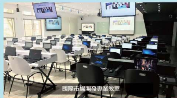
國際市場開發專業教室

歡迎到龍華首頁招生資訊：111進修部四技單獨招生，下載簡章與報名表，立即上網預約報名，免收報名費。