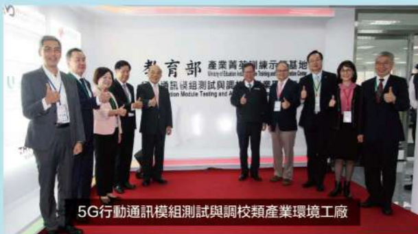
5G行動通訊模組測試與調校類產業環境工廠