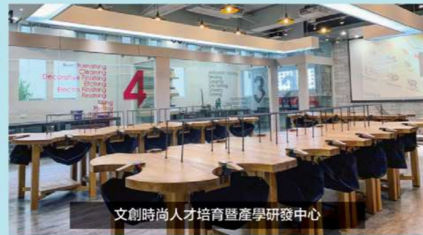
文創時尚人才培育暨產學研發中心